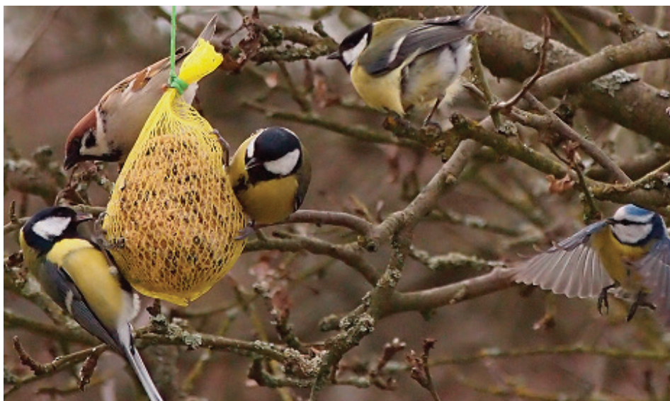
Autor: Jiří Bílek, Popelín

s rakouskou ornitologickou společností Birdlife Österreich a bavorskou ornitologickou společností LBV .