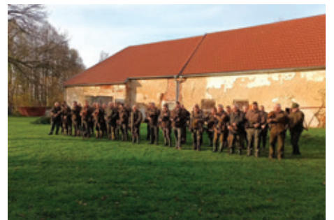
Naháňka v Horní Olešné