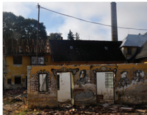
Demolice části objektu bývalé Frutry