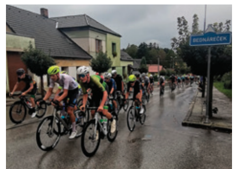
Okolo jižních Čech 2022