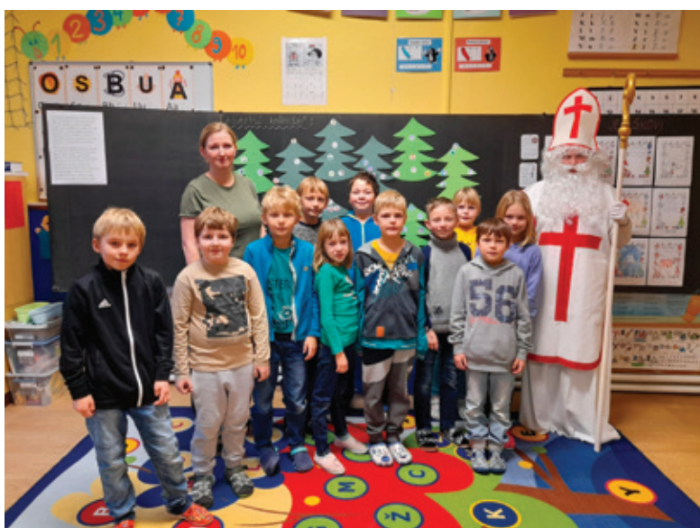
Mikuláš ve škole