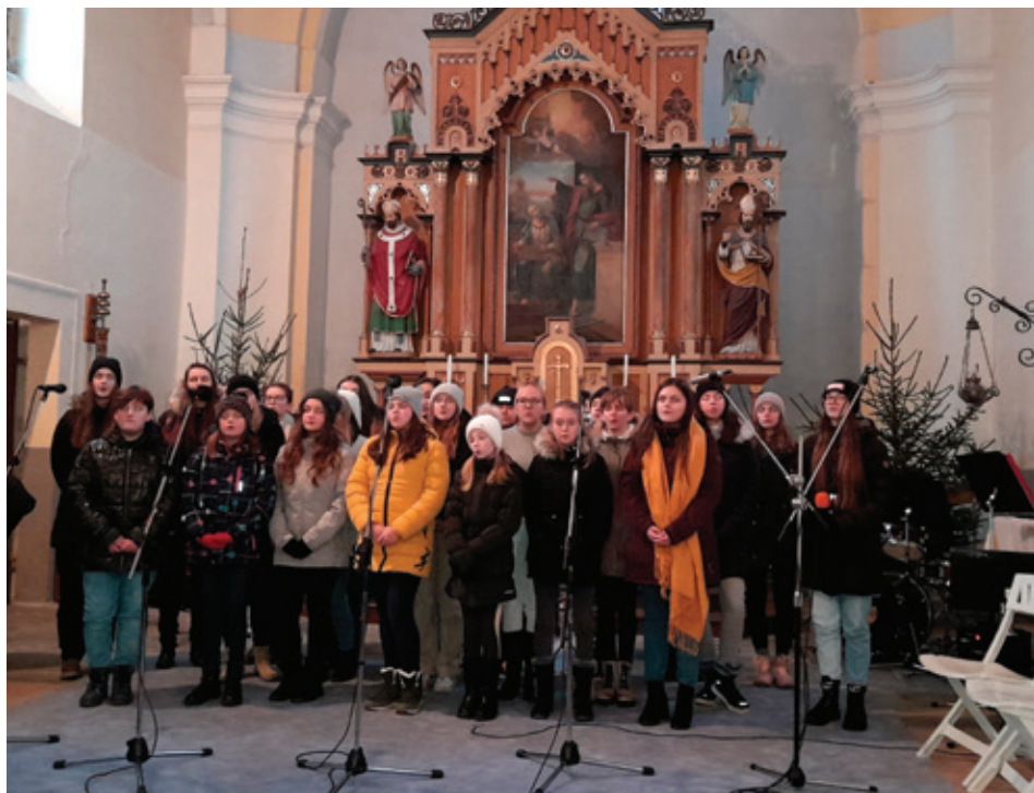
Vánoční koncert v kostele v Popelíně