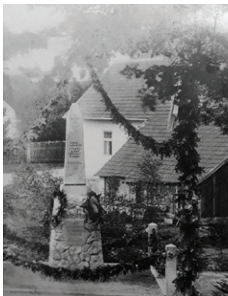
pomník v roce 1912