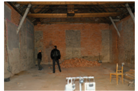
Výstavba hasičské zbrojnice