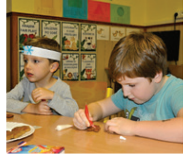
Vánoční tvoření v MŠ Popelín