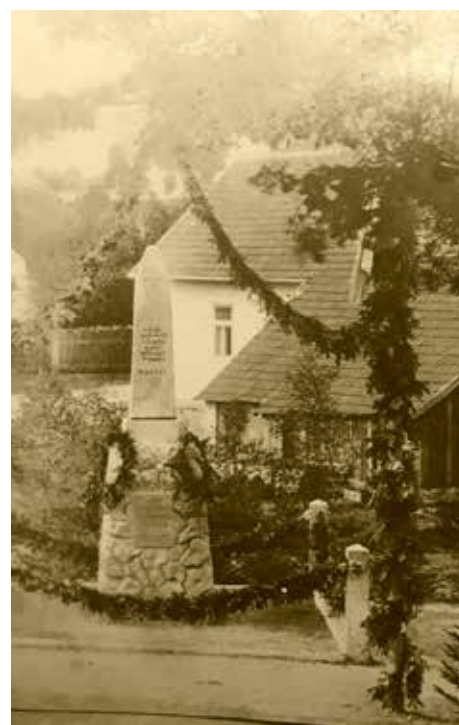
fotografie z roku 1912

Reportáž v „Ohlasu“ líčí, že většina účastníků se sešla v sousedním Bednářečku a odtud se pak slavnostní průvod vydal směrem k Popelínu. Nebylo to náhodně zvolené zahájení. Průvod totiž tím překročil česko-moravskou hranici – Bednářeček patřil ke korunní zemi Čechy, Popelín, kde se shromáždili ostatní účastníci, byl tehdy už na Moravě. Ve stejném duchu proběhl i konec slavnosti. Dechová hudba k tomu – jak píše „Ohlas“ – na závěr zahrála moravskou „národní hymnu“ – „Moravo, Moravo“ –, a pak českou – „Kde domov můj“. To bylo zajisté míněno jako reference pořadatelské obci Popelínu, jako výraz „bratrské“ sounáležitosti obou zemí ve jménu společného národního uvědomění.