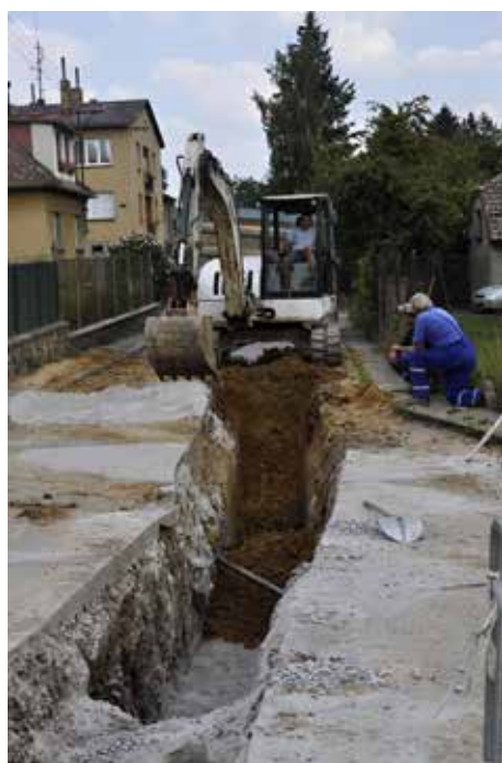
Budování kanalizace s ČOV