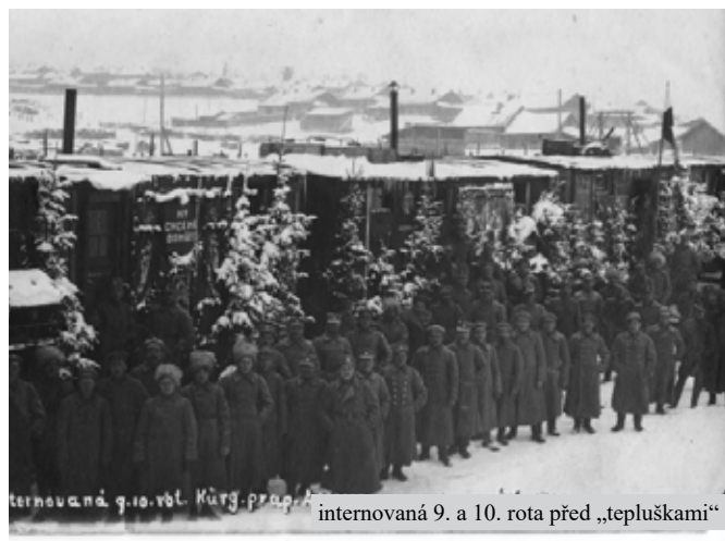
internovaná 9. a 10. rota před „tepluškami“