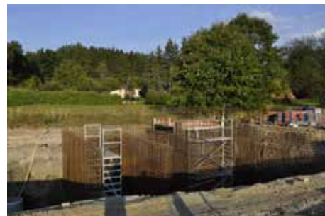
Budování kanalizace s ČOV