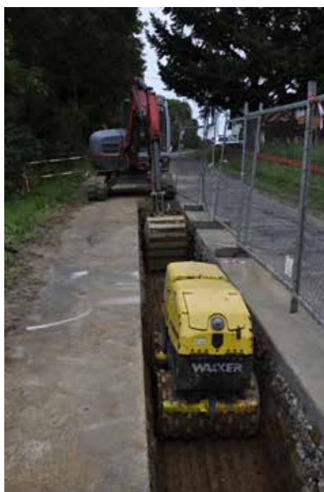
Budování kanalizace s ČOV