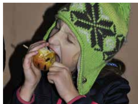
ZŠ a MŠ Popelín