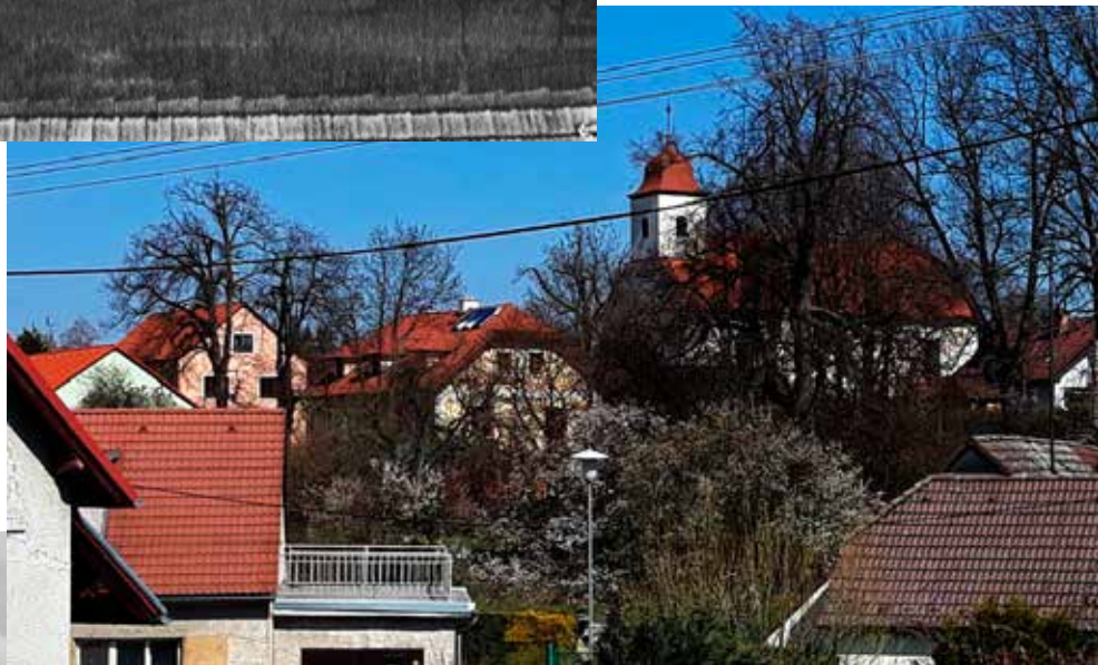
Na snímku z roku 2019 zaniká v okolní zástavbě a mezi vysokými stromy