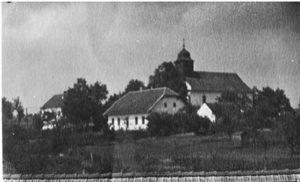
Dominantní skupina budov kostela, fary a školy přibližně ve 30. letech 20. st.