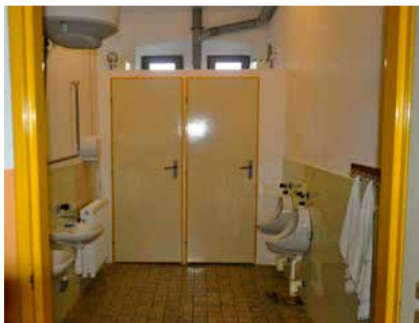
ZŠ a MŠ - WC před rekonstrukcí