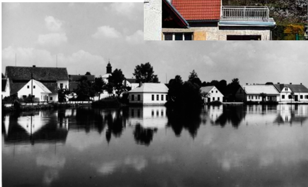
Pohled přes rybník 2019