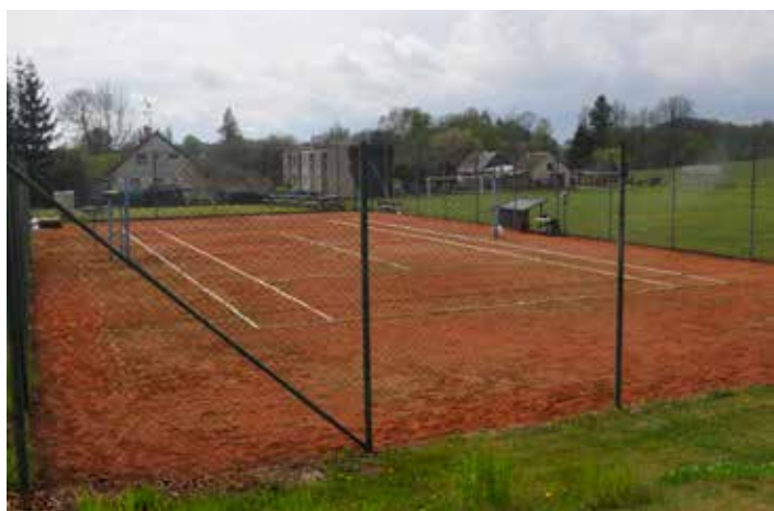
Tenisový kurt před rekonstrukcí